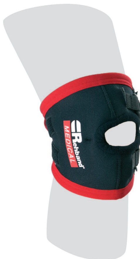
Patellaluxations-Bandage Bandage sous-patellaire Bendaggio per lussazione della patella