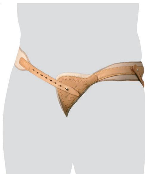
Bruchband Ceinture herniaire Cintura per ernia