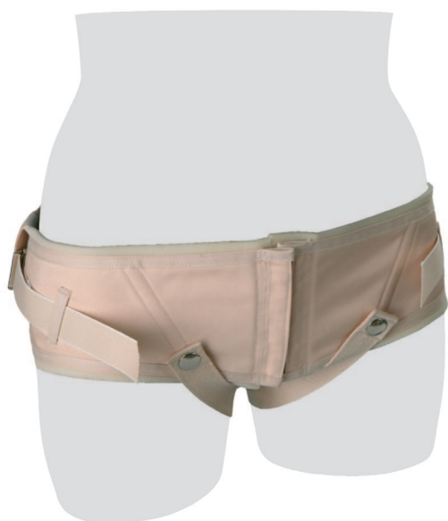
Trochantergurt Camp Ceinture pelvienne Camp Cintura pelvica Camp