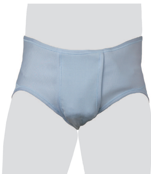
Unterhose mit Pelotten Culottes avec pelotes Mutande con pelotte