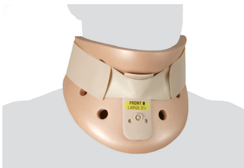
Plastazote Kragen "Philadelphia" Minerve en plastazote "Philadelphia" Collare "Philadelphia" in plastazote