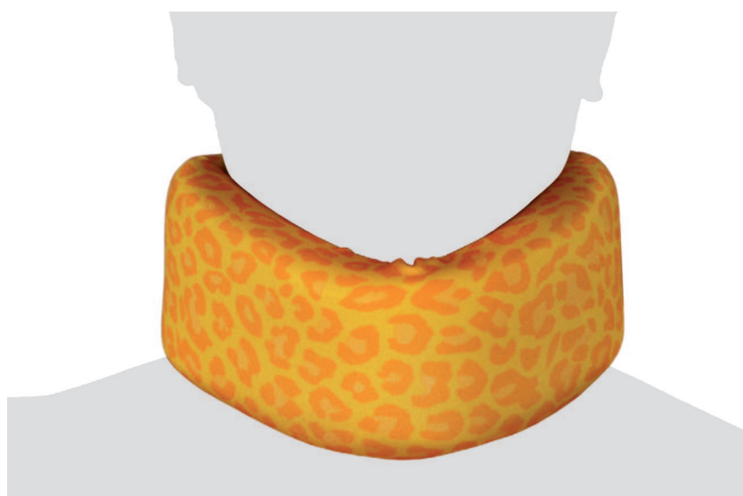
Schanz'scher Kragen Collerette de Schanz Collare di Schanz