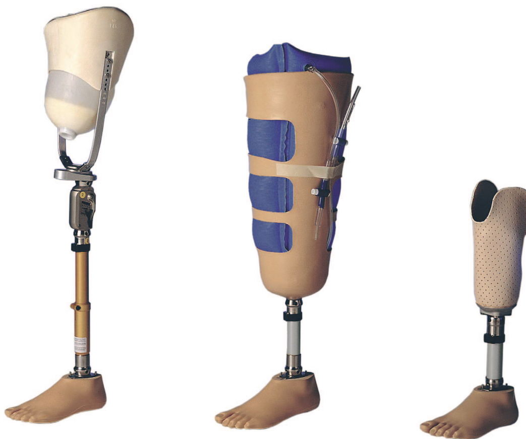
Provisorische Prothesen Prothèses provisoires Protesi provvisorie