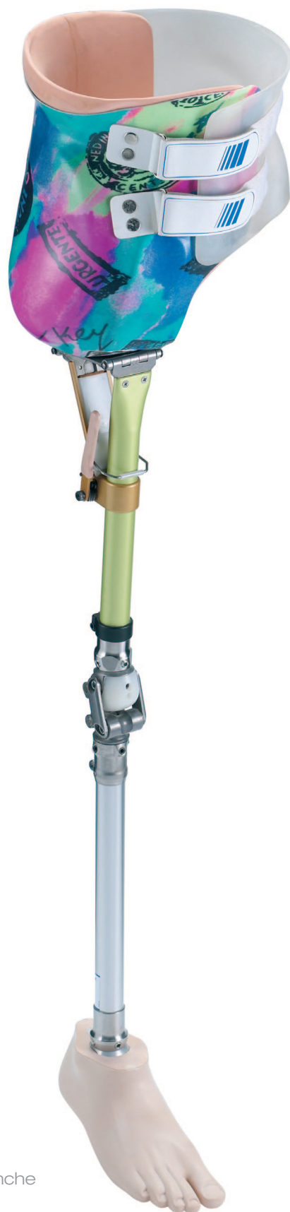
Hüftexartikulations-Prothese Prothèse de désarticulation de la hanche Protesi di disarticolazione dell'anca