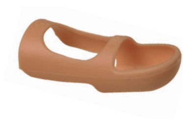
Winterstein Schiene Attelle Stack Stecca di Stack