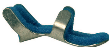
Fingerlagerungs-Orthese Alu Orthèse de doigt en Alu Ortesi di posizionamento delle dita in alluminio